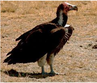
* Buitre: Necrófago